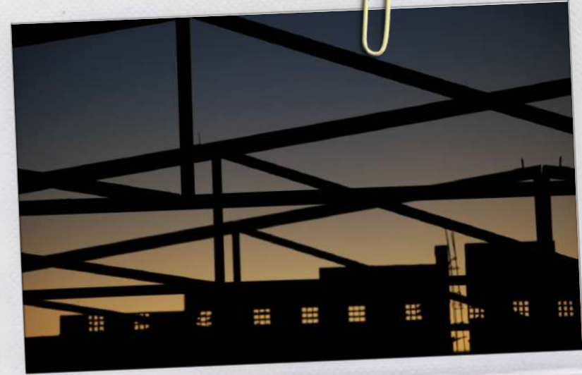
LEVER DE SOLEIL AVEC LES FERMES

Salade mixte, poulet, pomme de terre, jus de melon