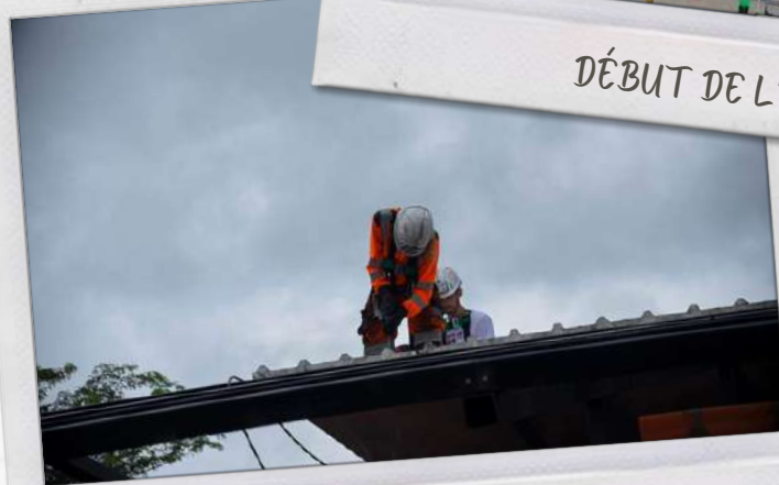
POSE DE LA COUVERTURE