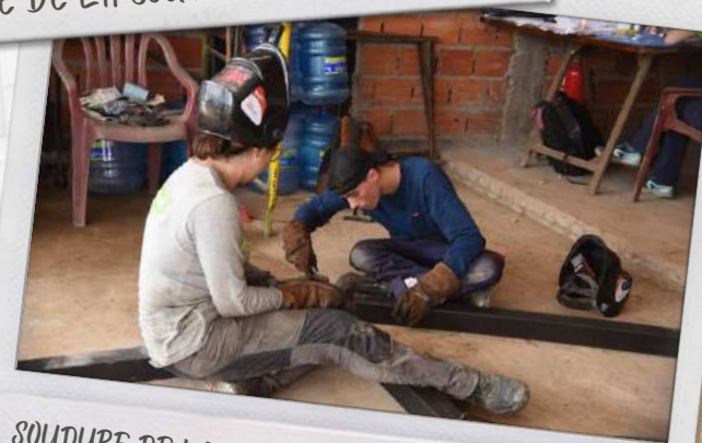
SOUDURE DE LA STRUCTURE DU CHÂTEAU D'EAU