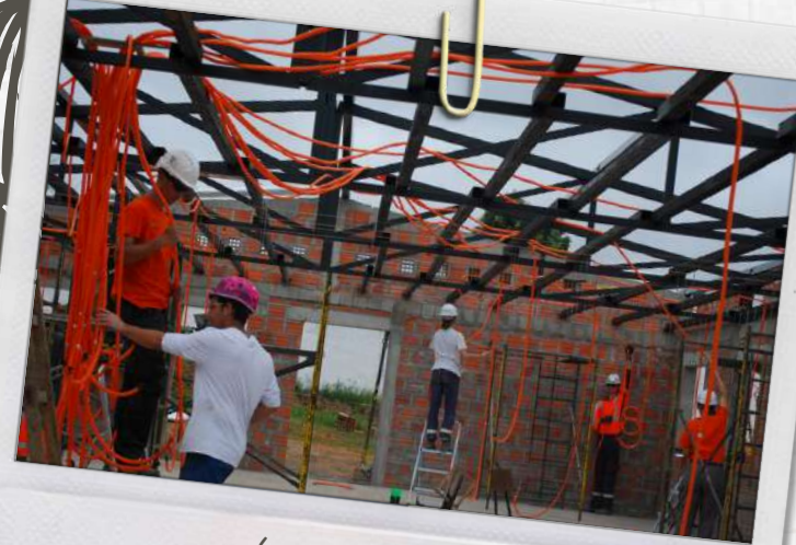
DÉBUT DE L'ÉLEC