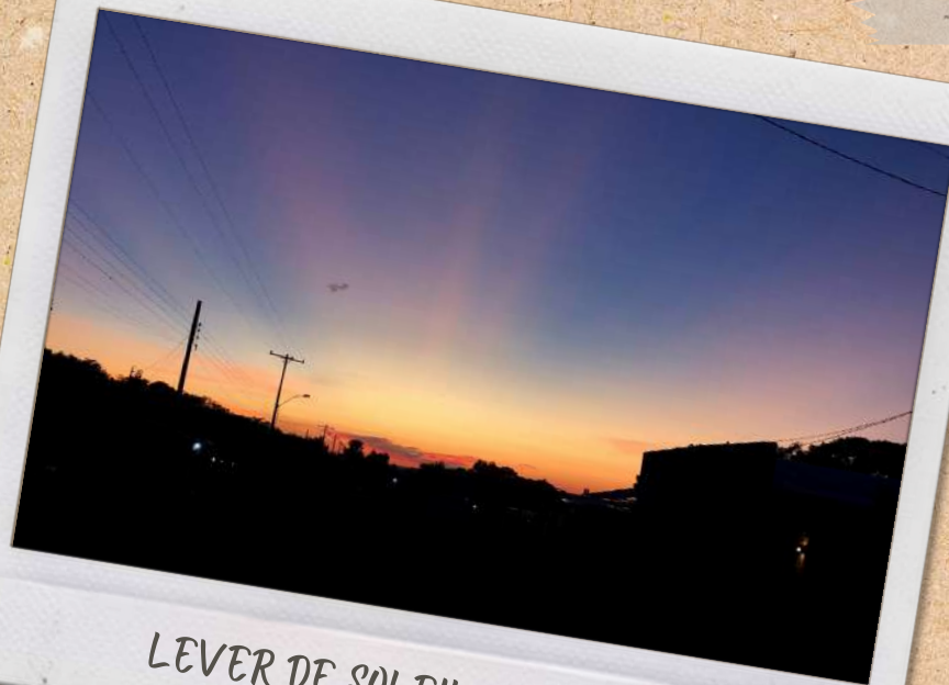
LEVER DE SOLEIL SUR CHANTIER

Saladé de choux, pâtes et viande en sauce, jus